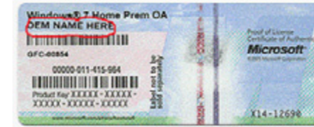
Primer COA nalepnice sa nazivom proizvođača